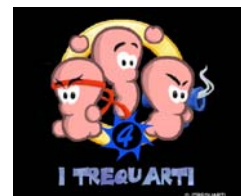
Il logo dei Trequarti