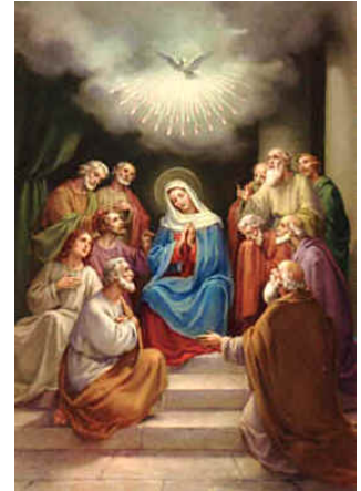
Lo spirito santo

Quando è stato trovato il cadavere sembrava oramai rosolato sulla carbonella ardente. La madonna ha deciso di farlo imbalsamare con la merda d'asino e di celebrare il funerale a casa di Giuda.