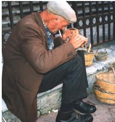
Il vecchietto vincitore