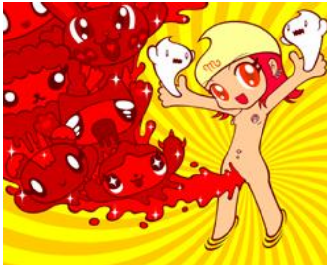
Il mestruo della Madonna