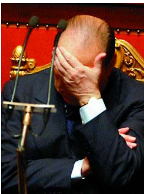
Berlusconi dopo averlo preso in culo

Fa il giro del mondo la notizia battuta dalle agenzie questa mattina. Infatti secondo un quotidiano tedesco, pare che berlusconi abbia confessato di averlo preso in culo. La notizia ha fatto scalpore non tanto per la sua cruda realtà, ma quanto per la motivazione. Infatti Silvio stava per rimane-