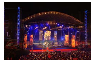
Il concerto dei Trequarti per presentare il nuovo album.

In vista ci sono un mucchio di novità, ci dicono i tre mongoli, quindi non ci resta che seguirli sempre con attenzione e devozione!