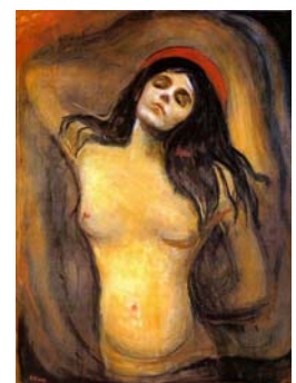
La Madonna dopo lo stupro.

La Madonna ora è ricoverata al "Fatebene i Piselli" ed è in prognosi stuprata.