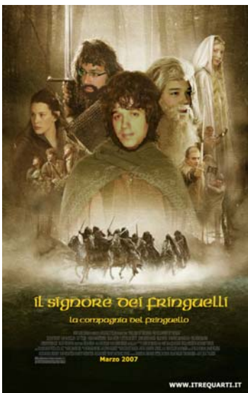
La locandina del film