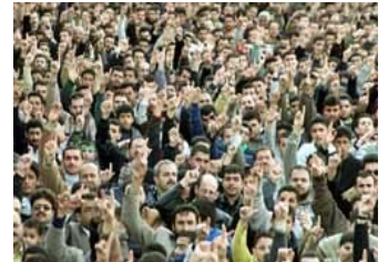
La folla fuori da Ricordi Bastardi a Roma