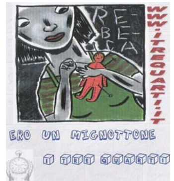
La copertina del nuovo album

L'album è appena uscito.....ed già successo!!!