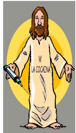
Cristo colto in flagrante

Ora la decisione spetta alla F.I.S.I.C.(Federazione Italiana Sborrate In Culo), che renderà pubblica la sua decisione tra una settimana.